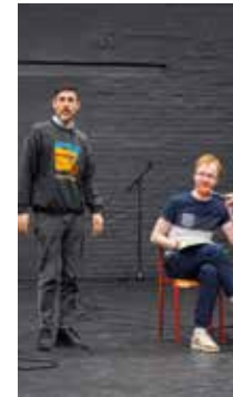
Cœurs à l'envers Conception Amélie Perrot & Yuval Rozman P 15