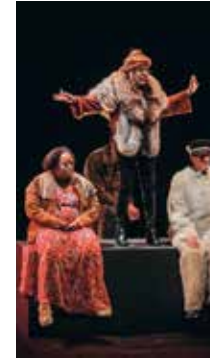
Loin dans la mer Avec la Cie 13/31 Écriture et mise en scène Lisa Guez P 08