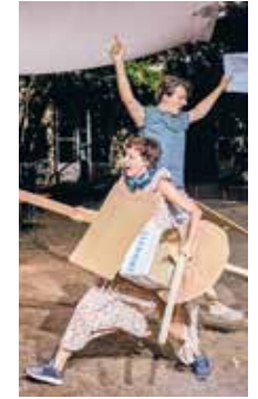
Quichotte Avec le Théâtre Permanent Mise en scène Gwenaël Morin P 12