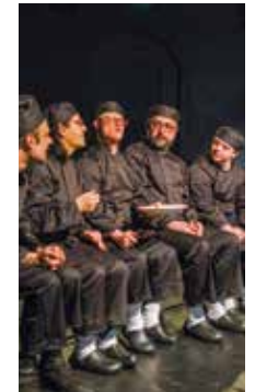
Bon Appétit Avec Hijinx Direction artistique Ben Pettitt-Wade P 17