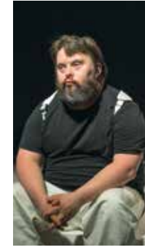
Saturne Avec la Cie Ex-Oblique Conception Noémie Ksicova P 10